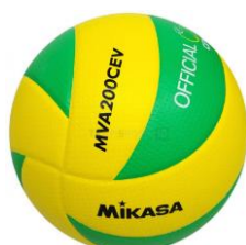
MIKASA MVA 200 CEV