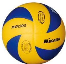
MIKASA MVA 200