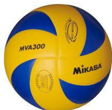
MIKASA MVA 300